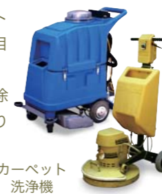
カーペット洗浄機

毎日様々な人が歩いているカーペットはホコリやダニなどによって見た目以上にとても汚れています。カーペット洗浄により、通常のお掃除ではとれにくい毛束の奥までしっかりと汚れを取り除きます。