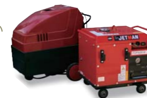
定期や日常、特別清掃用高圧洗浄機

高圧水をノズルから噴射し、配管・建物の外壁の汚れを洗い流します。配管は悪臭、衛生害虫の発生や配管の腐食などの排水トラブルを未然に防ぎます。外壁は付着したコケやカビを取り除き、美観を保ちます。